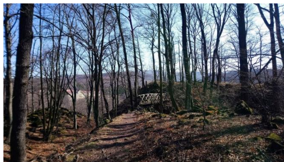
3. ábra. A Kecske-bérc és a Mátrai Gyógyintézet nyáron és késő ősszel