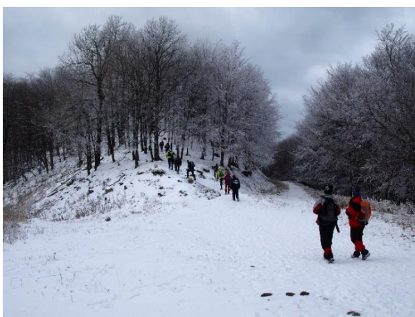
4. ábra. A Sötét-lápa nyerge télen (a Téli Máttra teljesítménytúra alatt).