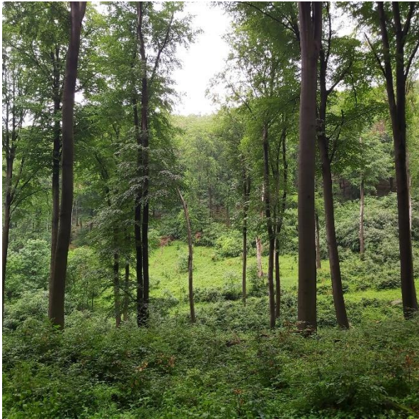
6. ábra. A Somor-patak felé vezető út részlete.

A nyeregtől a kék és sárga sáv jelzés visz fel a Kékestetőre, ahol a TV toronyhoz és a csúcsot jelző kőhöz (5. ábra) érkezünk meg. Utunk magashegységi illúziót kínáló környezetben, meredek hegyoldalak, sziklák és számos kilátópont mellett vezet idáig.